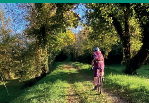
Pistes vtt rando & gravel à proximité

⚠️ Cartes bleues non acceptées (Faire l'appoint en espèces)