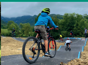
Pumptrack au pied des pistes VTT